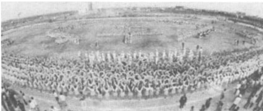
图为大型团体操第四场《丰收锣鼓》中的一个场面。

黄河波涛 邀来各界宾 客，巍巍大桥 欢迎八方健 儿。仲秋佳节， 垦利县城大街 小巷悬挂起巨 幅标语和过街 横幅。全市人 民迎来了市四 运会的召开， 共同欢渡黄河 口的盛大节 日。 22日下午2点 30分，四运会开 幕式在锣鼓声、鞭炮 声、掌声中举行。 1500名运动员、教 练员迈着雄壮的步伐 入场。碧空万里，白云朵朵，来自省 竞技体育学校的15名运动员乘坐的国产 草绿色运五飞机，从运动场上千米高空 掠过。15条象征着喜从天降的彩带飘然 落下。紧接着四朵伞花在空中相继开放。 运动员携带的各色彩旗随风飞舞，