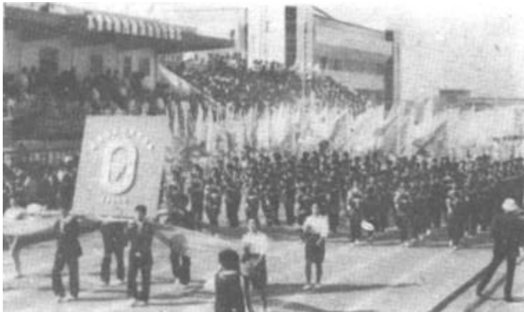
图为在开幕式上,运动健儿通过主席台。